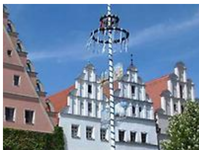
Stadt Weiden i.d. Oberpfalz