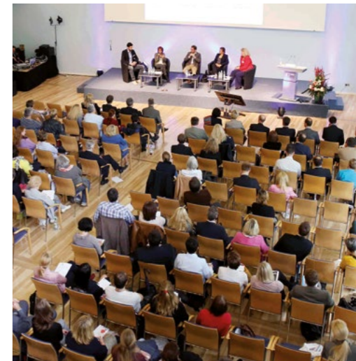
IHKs informieren ausführlich zur betrieblichen Gesundheitsförderung – wie hier die IHK für München und Oberbayern.