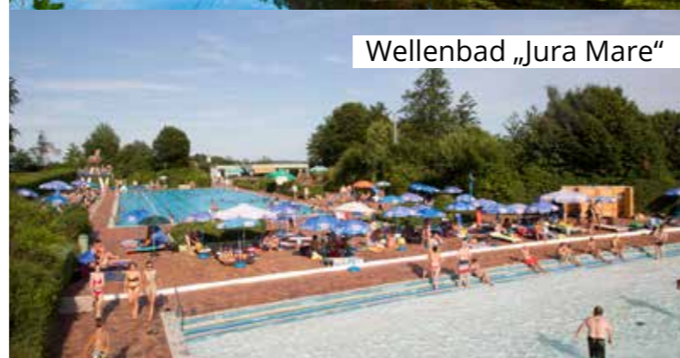
Wellenbad „Jura Mare“