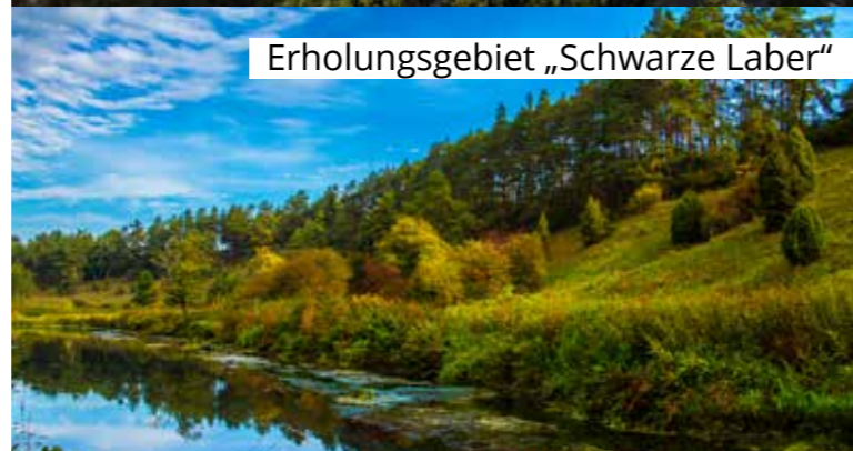
Erholungsgebiet „Schwarze Laber“