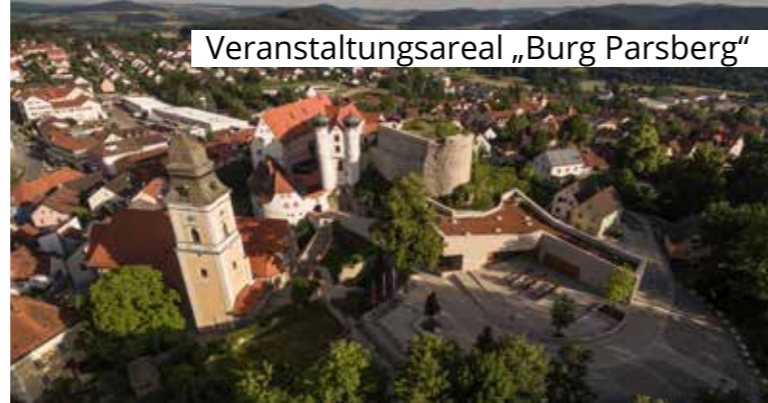
Veranstaltungsareal „Burg Parsberg“