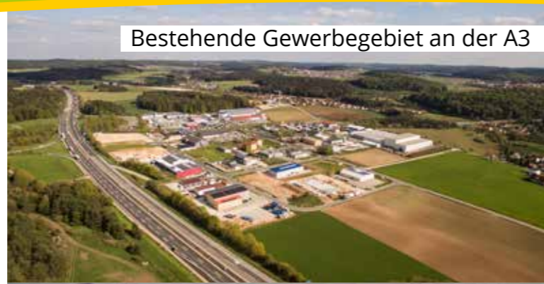
Bestehende Gewerbegebiet an der A3