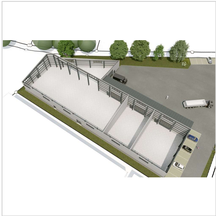
250606 FUNDUS GmbH Nabburg_ent

Sauerzapfstraße 3 92507 Nabburg Miet- / Kaufobjekt: Miete Lager- /Produktionsfläche: 1.700,00 m² Gesamtfläche: 4.700,00 m² Miete pro Monat: Preis auf Anfrage