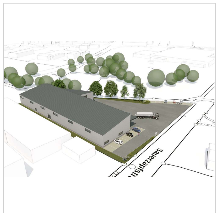
250606 FUNDUS GmbH Nabburg_ent