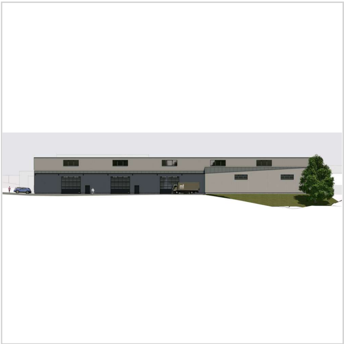
250606 FUNDUS GmbH Nabburg_ent