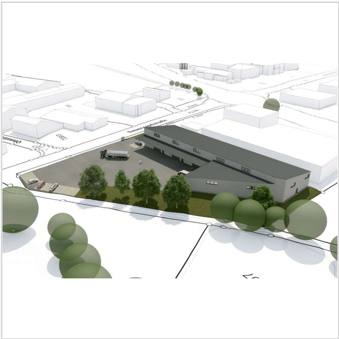
250606 FUNDUS GmbH Nabburg_ent