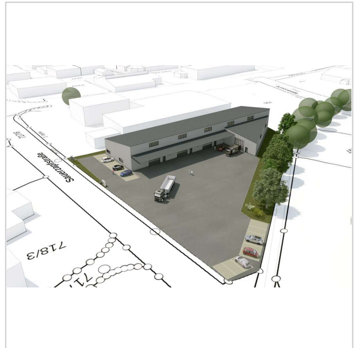
250606 FUNDUS GmbH Nabburg_ent

Das Grundstück befindet sich an der A93 500 Meter entfernt von der Autobahnausfahrt Nabburg - Richtung Norden im entwickelten Industrie- und Gewerbegebiet.