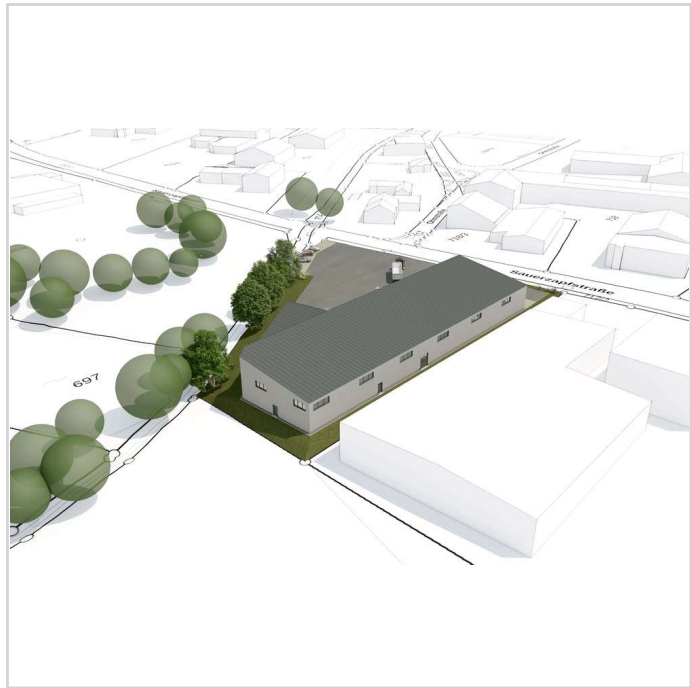
250606 FUNDUS GmbH Nabburg_ent

Sauerzapfstraße 3 92507 Nabburg Miet- / Kaufobjekt: Miete Lager- /Produktionsfläche: 1.700,00 m² Gesamtfläche: 4.700,00 m² Miete pro Monat: Preis auf Anfrage