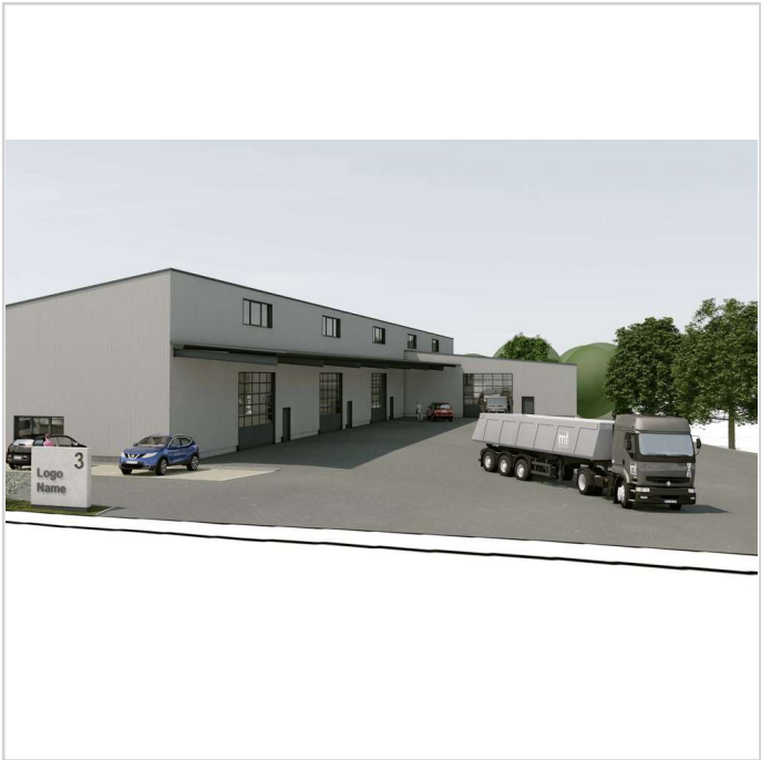
250606 FUNDUS GmbH Nabburg_ent