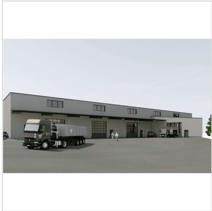
250606 FUNDUS GmbH Nabburg_ent