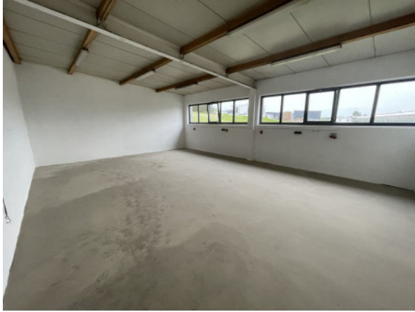
Innenansicht Nebenraum 1