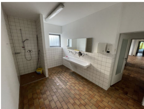
Innenansicht Dusche/ Waschen