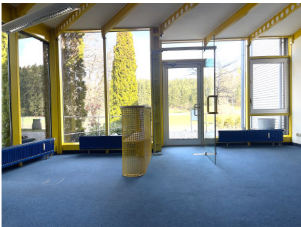
Innenansicht Büro, Entrée/ Empfang