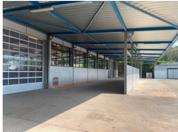
Außenansicht überdachte Freifläche, Sektionaltore