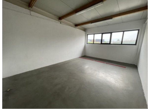
Innenansicht Nebenraum 2