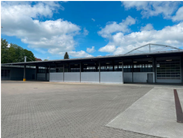
Außenansicht Halle, überdachte Freifläche, Zufahrt über Hof