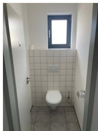
Innenansicht Büro, WC Damen