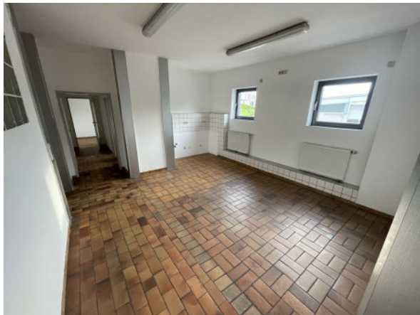
Innenansicht Küche/ Aufenthaltsraum