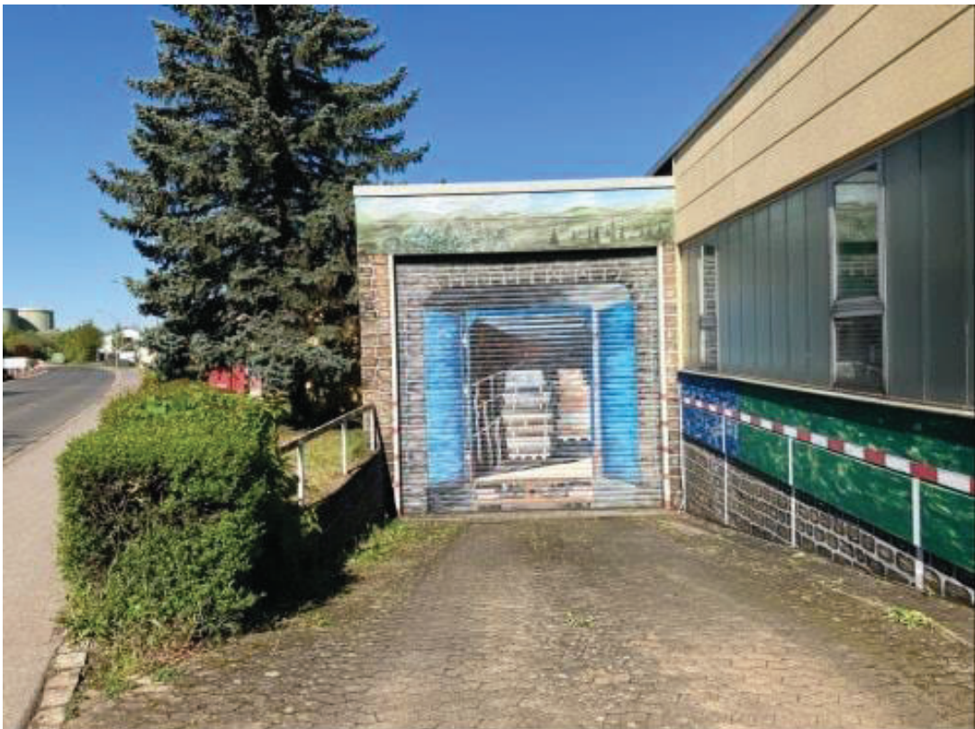
Ansicht - Toranlage