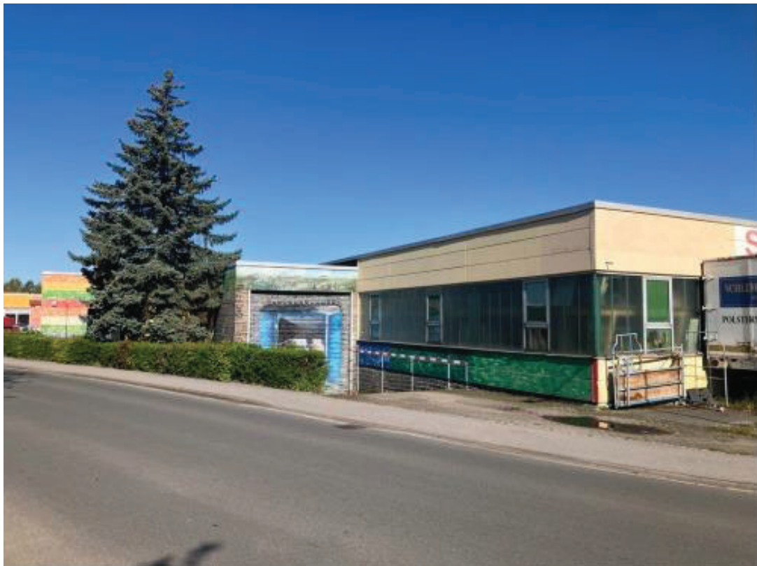
Ansicht mit Ladebereich