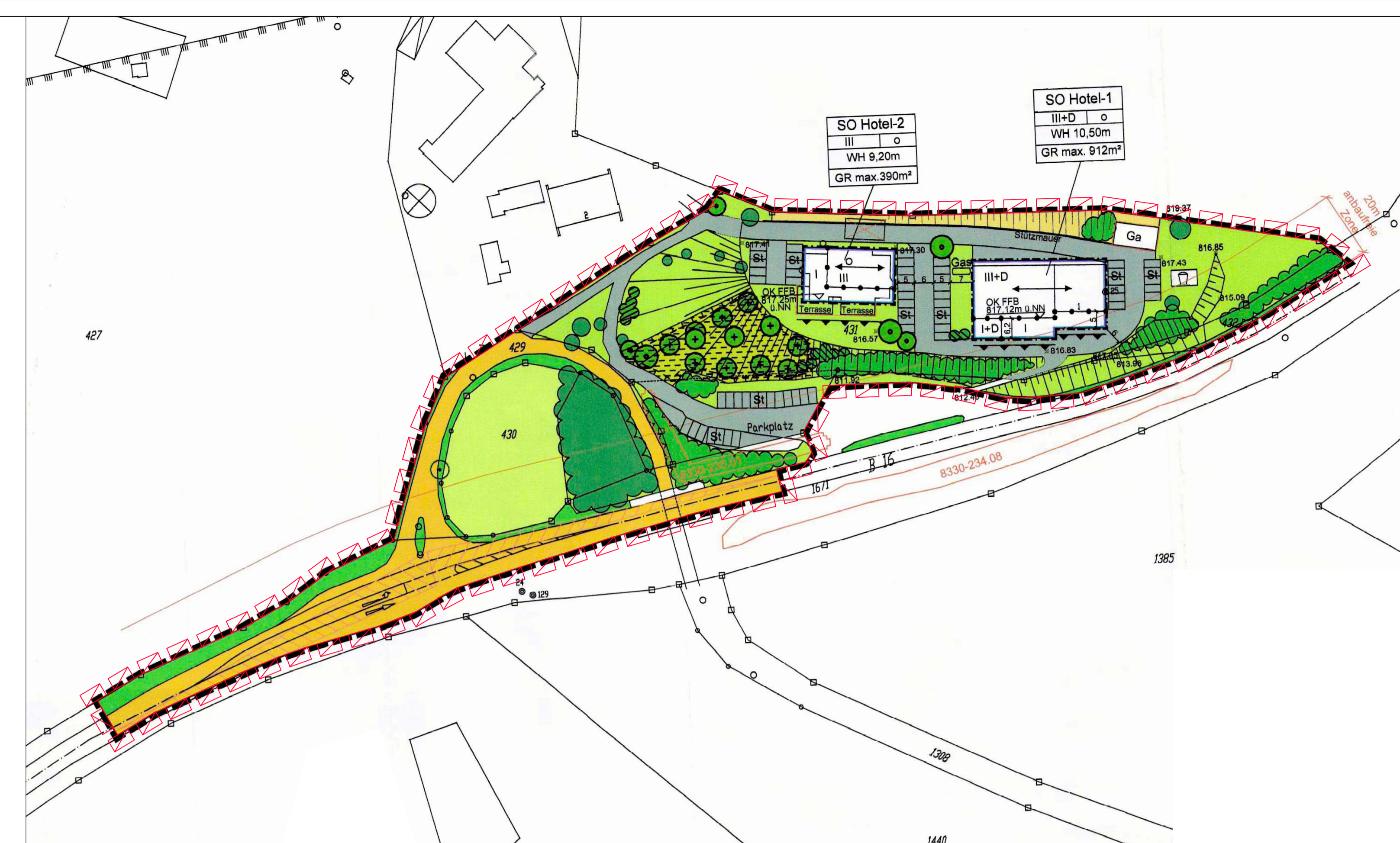
Bebauungsplan Nr. 15 "Hotel Schwarzenbach - Dietringen" (Fassung vom 22.08.2011, rechtsverbindlich seit 04.11.2011)