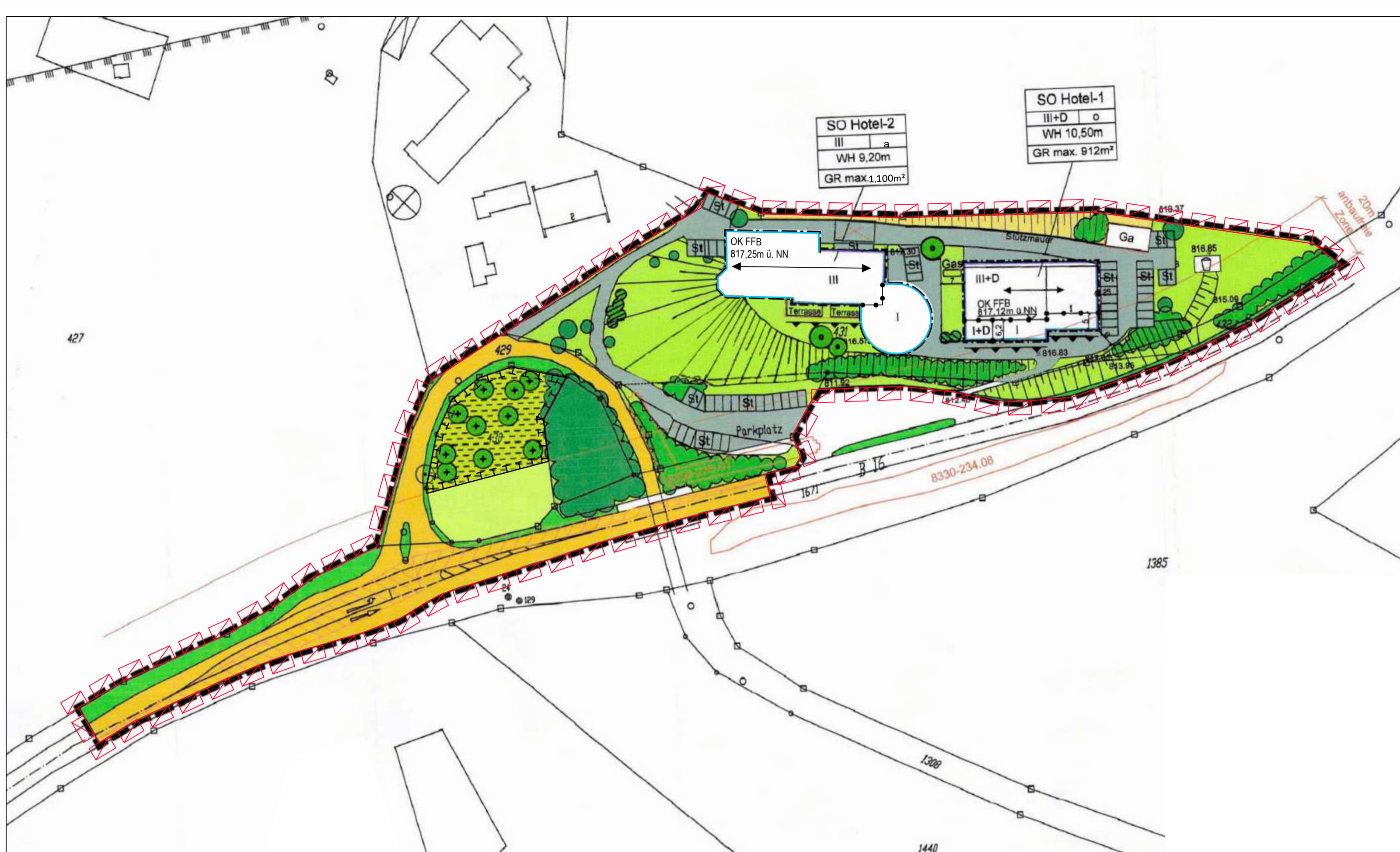
1. Änderung des Bebauungsplanes Nr. 15 "Hotel Schwarzenbach - Dietringen"