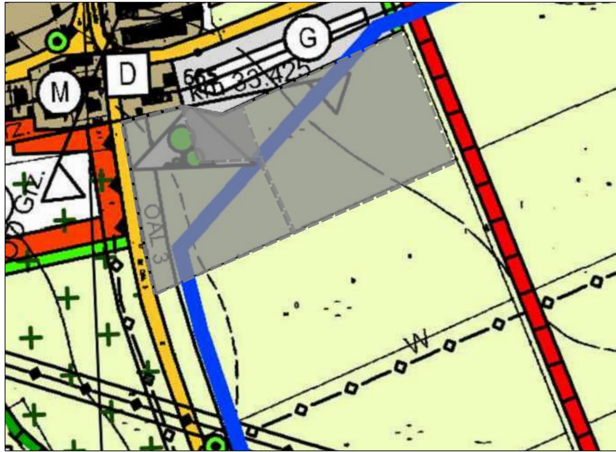
Ausschnitt aktueller Flächennutzungsplan im Ortsteil Lauchdorf (Stand 16.05.2006)