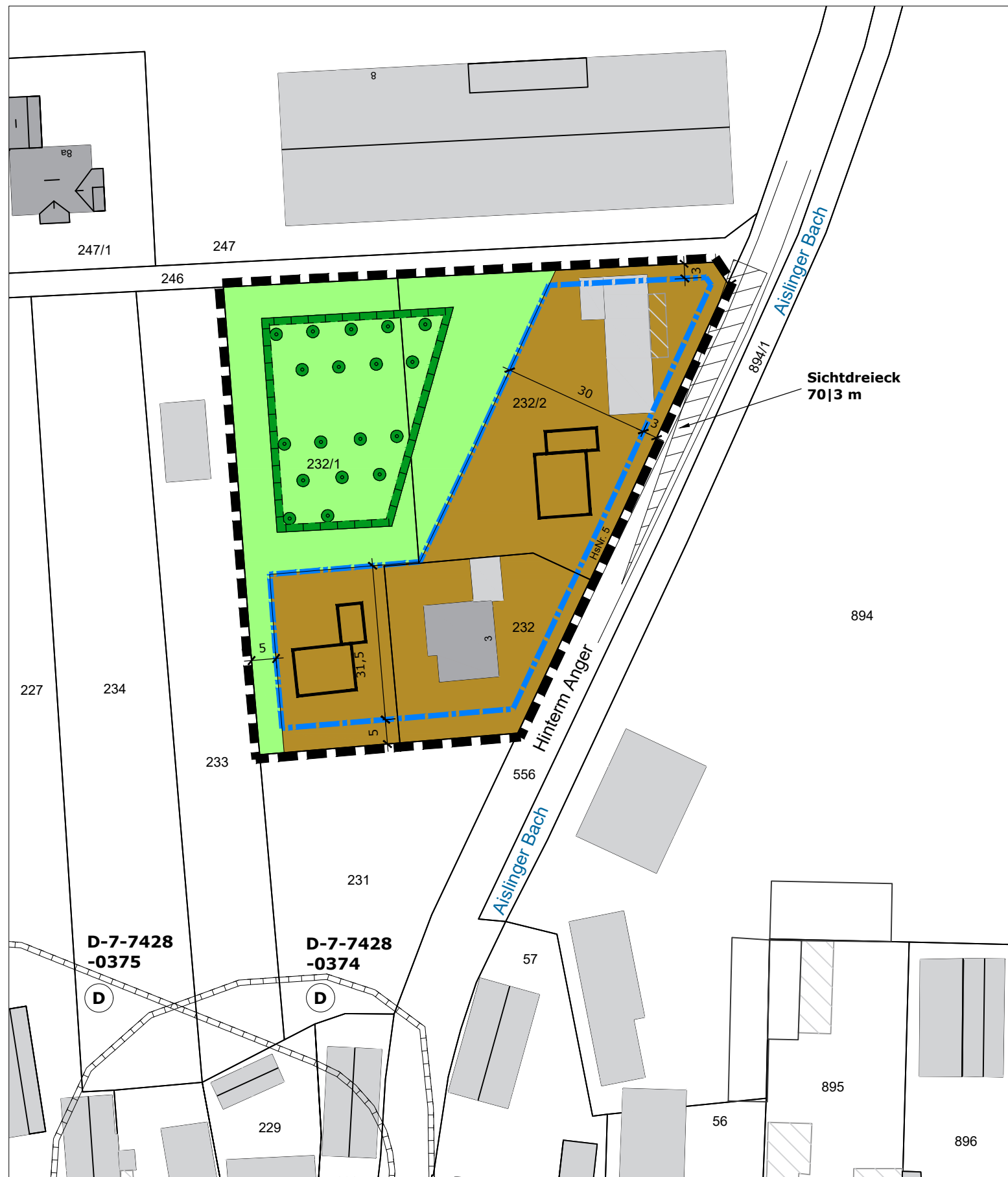
Planzeichnung Maßstab 1:1.000