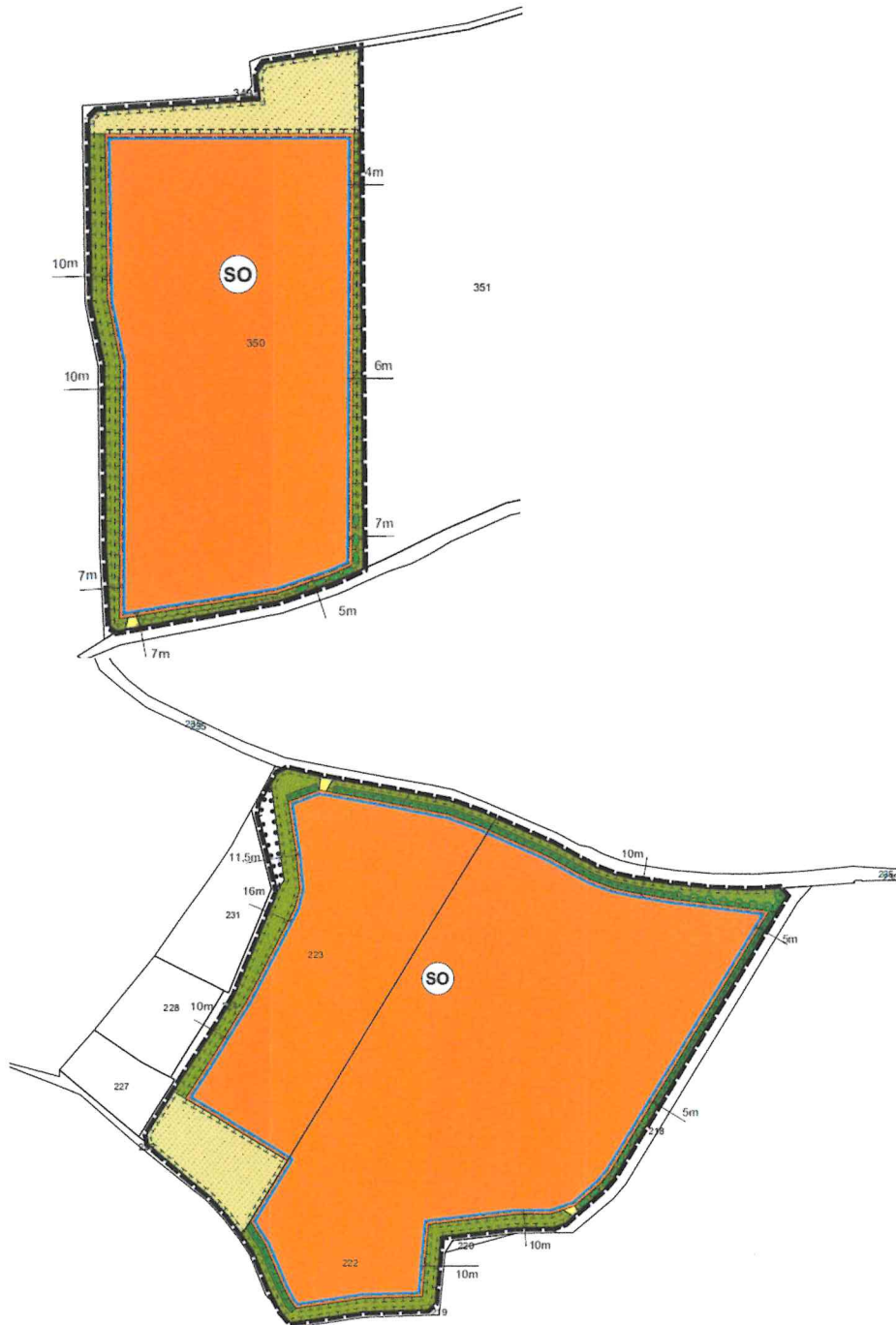
Abb. Darstellung des Vorhabens (ohne Maßstab)

Ziel der Planung ist die Ausweisung eines Sondergebietes für eine Freiflächen-Photovoltaikanlage und von Batteriespeicher innerhalb eines nach dem Erneuerbare-Energien-Gesetzes „landwirtschaftlich benachteiligten Gebietes“, um dem Bedarf an erneuerbaren Energien zu entsprechen.