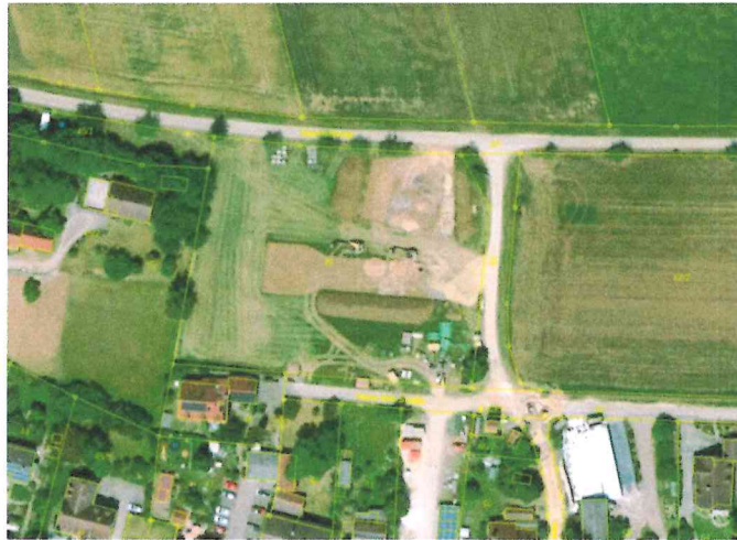
Abb. Übersicht Lage 7 Geltungsbereich des Vorhabens ohne Maßstab

Der Geltungsbereich umfasst die Fl.Nr. 45, Gemarkung Absberg. Diese Fläche befindet sich am nördlichen Ortsrand des Ortes Absberg, angegliedert an den Dorfkern.