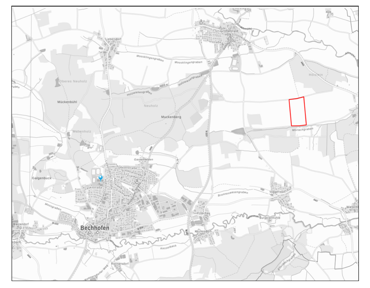
Kartengrundlage: Geobasisdaten © Bayerische Vermessungsverwaltung 2023