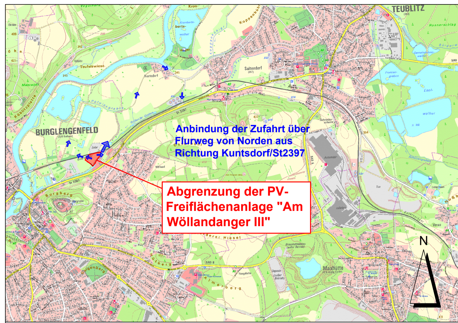
Übersichtslageplan M 1:25.000