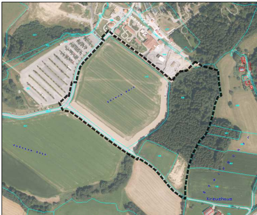
Übersichtsplan Plangebiet mit Geltungsbereich (Strichlinie schwarz).

Der Geltungsbereich der Änderung durch Deckblatt Nr. 22 umfasst eine Gesamtfläche von insgesamt 98.469 m 2 (ca. 9,8 ha) und wird gebildet aus den Flurnummern 413 (TF), 426 (TF), 435 (TF), 440/2 (TF), 443, 446 (TF), 448 und 449 (TF), 460 (TF) der Gemarkung Obermühlbach.