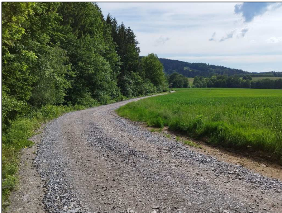
Blick von Norden nach Süden auf den Betriebsweg. Rechts das obere Feld.

An der Ostseite der Flurnummer 443 zweigt der Schotterweg nach Norden ab und führt als Betriebs- und Feuerwehrzufahrt bis zum Bestandsgelände bei den Achterbahnen.