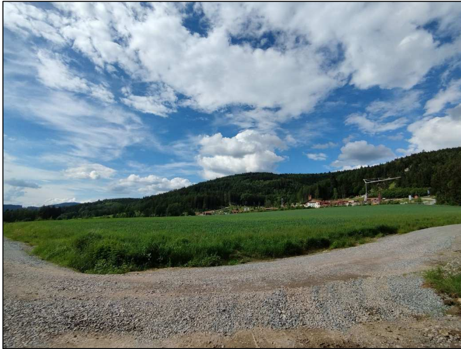
Blick von Südosten nach Norden auf das obere Feld und den Freizeitpark.