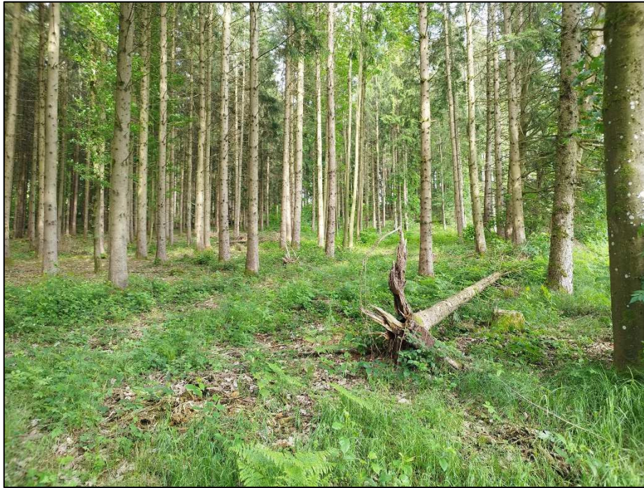
Fichtenforst ohne Strauchschicht