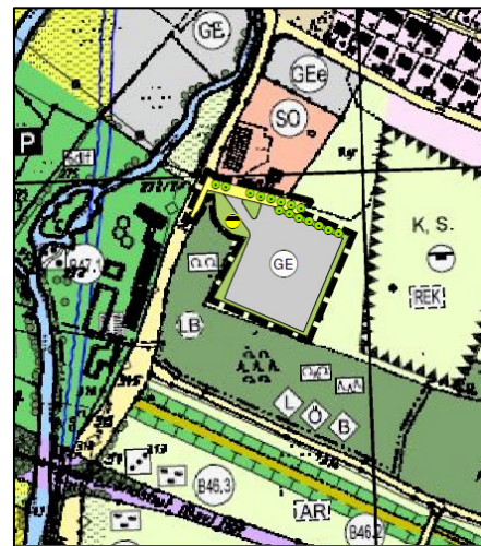
FNP/LP – Fortschreibung

Quelle: Stadt Vilsbiburg; verändert KomPlan; Darstellung nicht maßstäblich.