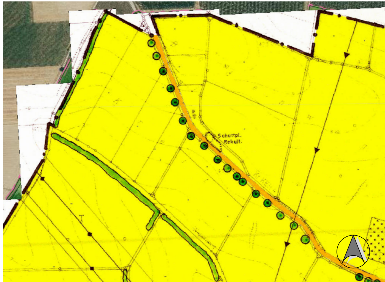
Rechtsgültiger Flächennutzungsplan vor der Änderung