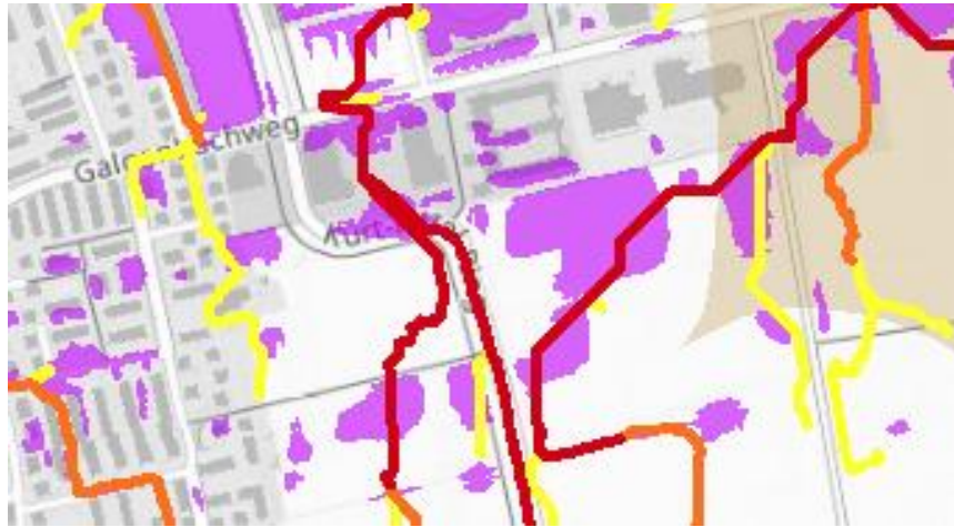
Abb. 4 Hinweiskarte Oberflächenabfluss, ohne Maßstab, abgerufen am 02.10.2025

Laut Hinweiskarte Oberflächenabfluss des Bayer. Landesamtes für Umwelt ist im Plangebiet mit Aufstaubereichen (pinkfarbene Flächen) und im näheren Umfeld mit Fließwegen mit starkem Abfluss (rote Linien) zu rechnen.