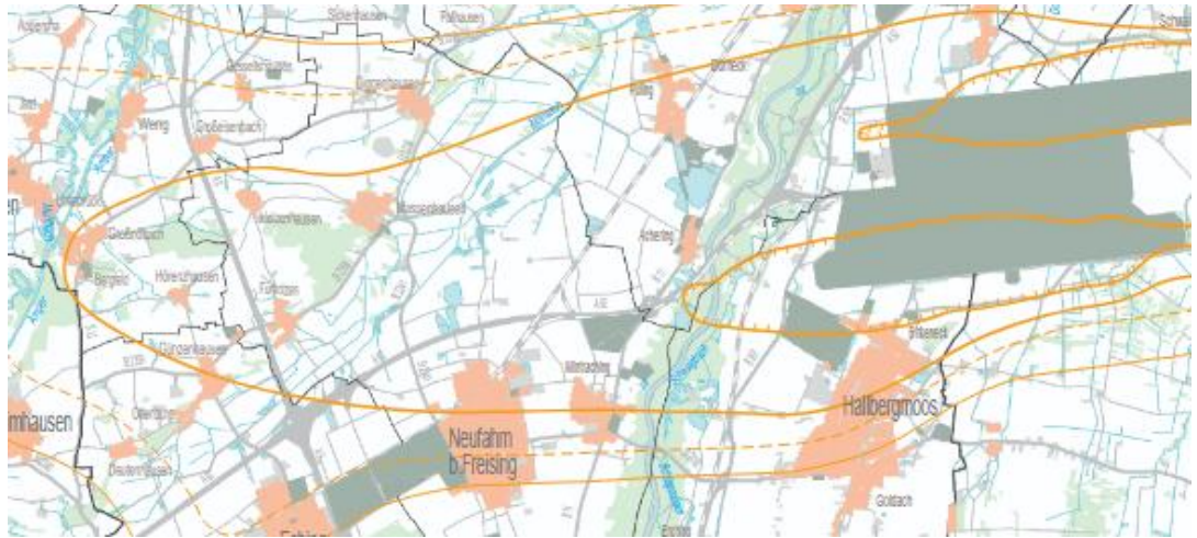
Abb. 7 Ausschnitt aus dem Regionalplan, Karte 2 Siedlung und Versorgung, Tektur Lärmschutzbereich 2 (Flughafen München) mit Plangebiet, ohne Maßstab, Stand 02.02.1987