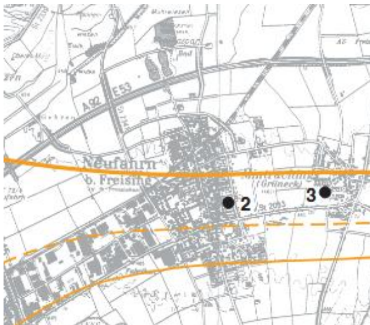
Abb. 8 Ausschnitt aus dem Regionalplan, Karte 2r Siedlung und Versorgung, Lärmschutzbereich für den Flughafen München, ohne Maßstab, Stand 02.02.1987

Da die geplante Erweiterung an den bestehenden Schulstandort anschließt, kann ggf. an immissionsbezogene Gutachten und Stellungnahmen zum Bestand angeknüpft werden. Die Regierung von Oberbayern hat mit Schreiben v. 05.12.2025 zur der Fluglärnthematik im Vorfeld Stellung genommen und festgestellt, dass die angedachte Planung den Lärmschutzbelangen der Landesplanung zum aktuellen Zeitpunkt nicht entgegensteht. Diese Übergangsregelung gilt jedoch nur bis zur Festsetzung eines Lärmschutzbereichs für den Verkehrsflughafen München nach § 4 des Gesetzes zum Schutz gegen Fluglärm; nach heutigem Kenntnisstand bis 31.12.2026.