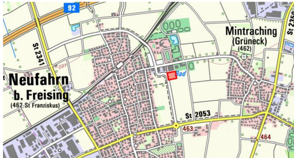
Abb. 2 Übersichtsplan mit Lage des Plangebietes, ohne Maßstab

Von der Änderung ist mit ca. 12.500 qm das Grundstück Fl. Nr. 1852/1 Gemarkung Neufahrn b. Freising betroffen.