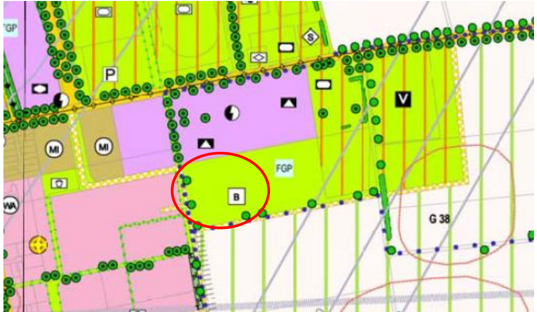
Abb. 9 Ausschnitt aus dem wirksamen FNP mit Lage der 33. Änderung, ohne Maßstab

Der wirksame Flächennutzungsplan der Gemeinde Neufahrn stellt das Plangebiet als öffentliche Grünfläche mit der Zweckbestimmung Bolzplatz dar. Außerdem legt er fest, dass ein Freilächengestaltungsplan vorzulegen ist. Die Trasse des Kurt-Kittel-Rings ist als freizuhaltend dargestellt. Des Weiteren gibt es Darstellungen von Bäumen als Grünstruktur und Wegebeziehungen. Südlich angrenzend wird landwirtschaftliche Fläche dargestellt, westlich Wohnbauflächen.