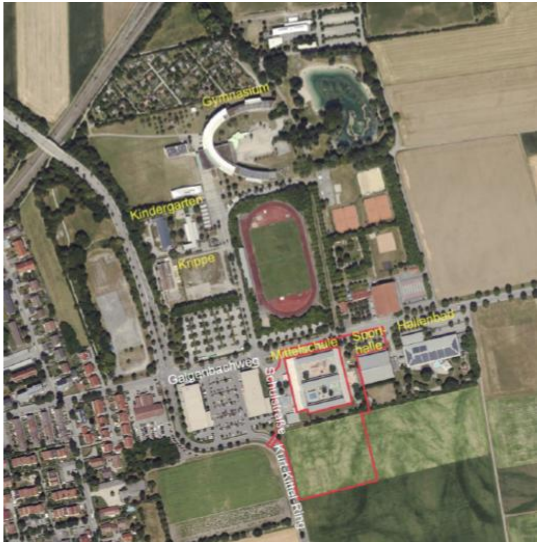
Abb. 1 Standort aus der Wettbewerbsauslobung, ohne Maßstab, Quelle: Gemeinde

Für die Flächen westlich des Kurt-Kittel-Rings, die derzeit noch landwirtschaftlich genutzt werden, bestehen Planungen für ein neues Wohngebiet „Neufahrn Ost“; ein wesentlicher Teil der künftigen Lernenden wird aus diesem Neubaugebiet kommen.