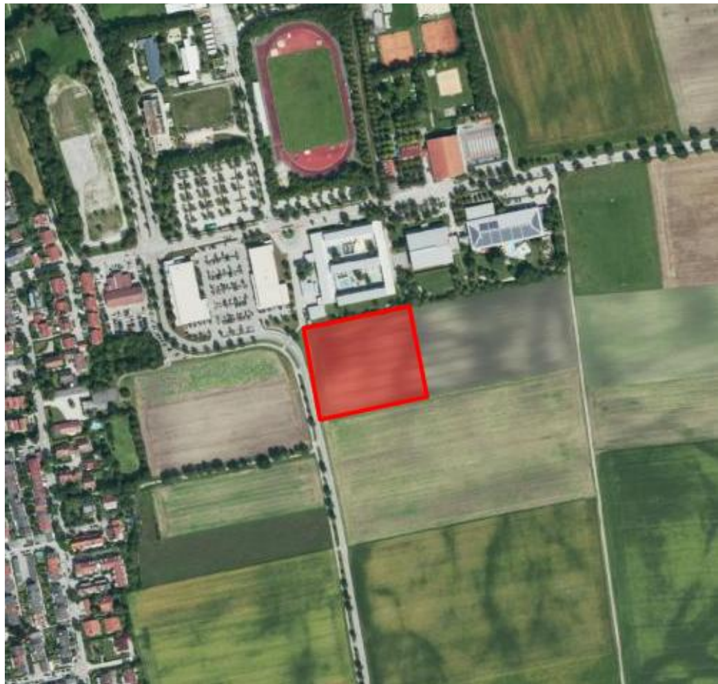
Abb. 3 Luftbild mit Plangebiet, ohne Maßstab, abgerufen am 27.08.2025

Von der Änderung ist mit ca. 12.500 qm das Grundstück Fl. Nr. 1852/1 Gemarkung Neufahrn b. Freising betroffen.